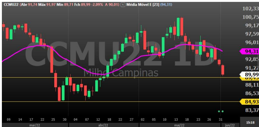
Figura 4 - gráfico diário Milho vencimento setembro/22