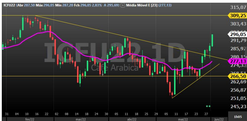
Figura 5 - gráfico diário Café Arabica vencimento Setembro/22