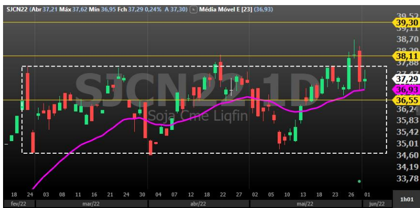
Figura 5 - gráfico diário Soja vencimento Julho/22

Café: Ainda carente de liquidez, café apresenta forte alta na sessão de hoje, registrando no momento da confecção deste relatório alta de 2,66% no vencimento setembro, aos US$295,55/saca.