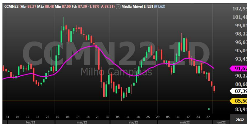
Figura 3 - gráfico diário Milho vencimento Julho/22

Boi Gordo: Embora ainda em tendência de baixa, a cotação da arroba apresenta volatilidade nessa virada de mês. O vencimento maio, que representa o período mais baixo da curva sazonal venceu ontem e foi liquidado a R$318,98. As escalas de abate alongadas exerceram pressão nos preços da arroba e embora não haja uma mudança forte nesse cenário, já há notícias de que as escalas ao menos pararam de alongar. Com as recentes baixas os pecuaristas ficam reticentes em entregar seus animais e isso pode trazer suporte aos preços. Atenção para a virada da curva sazonal que deve acontecer em junho.