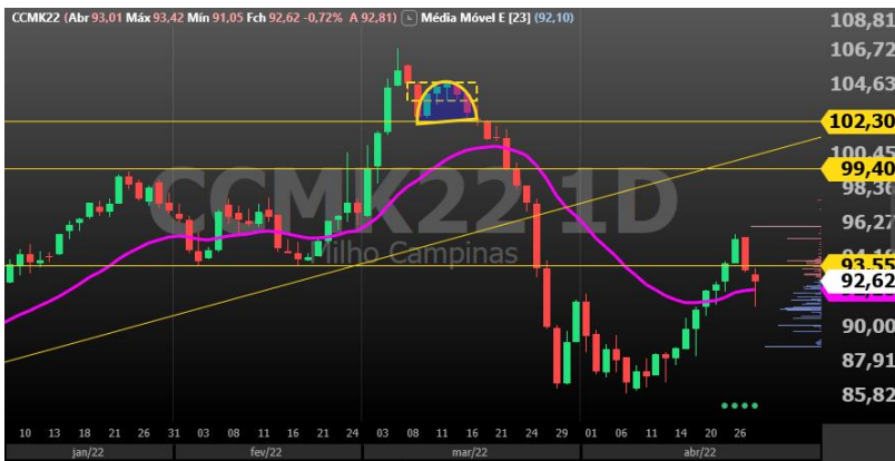
Figura 2 – gráfico diário Milho vencimento Maio/22