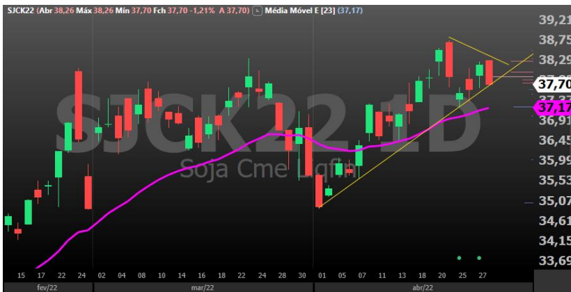
Figura 5 - gráfico diário soja vencimento Maio/22