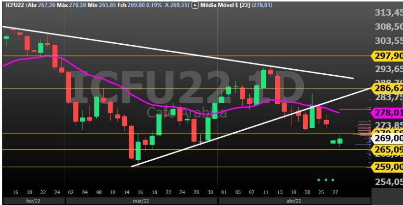
Figura 4 - gráfico diário Café vencimento setembro/22