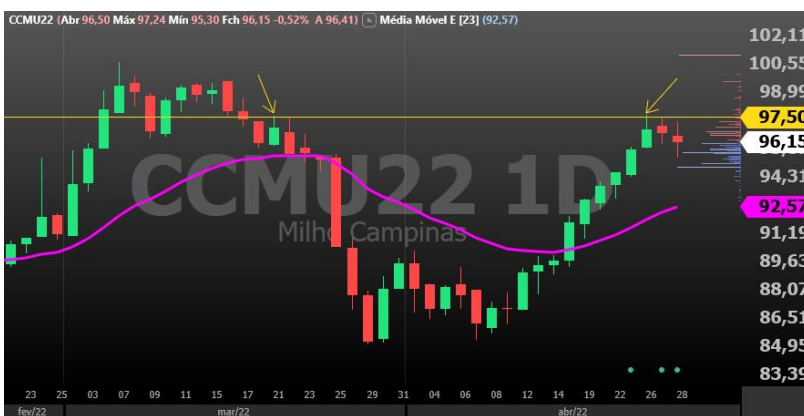
Figura 3 – gráfico diário Milho vencimento Setembro/22

Boi Gordo: Na semana passada comentamos aqui sobre a resistência curta mais relevante em 325,00 no vencimento maio, o BGIK22. Esta semana a força compradora vem se mostrando persistente e o rompimento da linha de 325,00 pode levar o mercado aos testes do nível de resistência anterior na região em torno de 331,00 e mais acima perto de 335,00. Na figura 1 é possível observar o rompimento do topo do pivô de alta no gráfico diário e o desafio agora é consolidar negociações acima da linha de 326,80, antiga linha de rompimento de pivô de baixa e mais recentemente centro de lateralização, portanto pode representar um patamar técnico onde o mercado fique “reticente” ao se aproximar. Para baixo, suporte em 324,00 e 322,00.