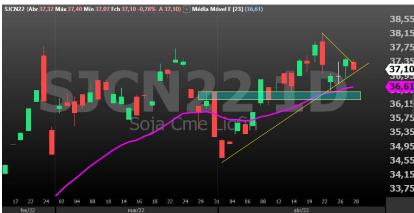
Figura 6 - gráfico diário Soja vencimento maio/22

Segundo o informe semanal de estimativas agrícolas da Argentina, 34% das lavouras de milho do país já foram colhidas, apontando aumento de 5 pontos percentuais a mais comparando com o mesmo período de 2021. Por aqui, a super safrinha segue mantendo a pressão baixista apesar da sabida queda de produtividade em determinadas regiões, mas ainda assim há expectativa de que a safra do MT seja "gigante".