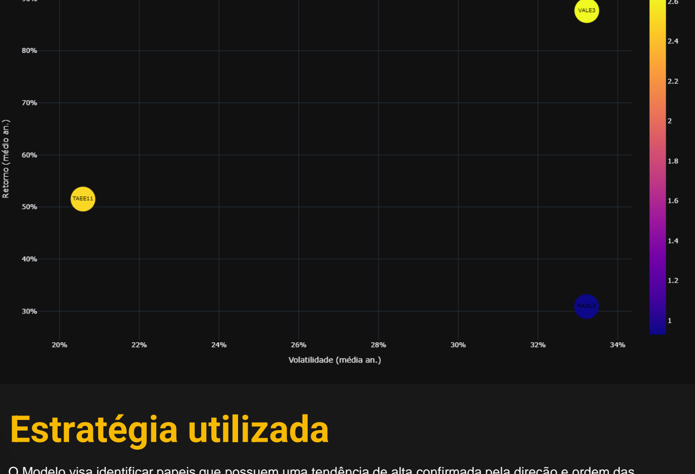
Gráfico Risco Retorno de Carteira: Quanto mais alto, Maior o retorno. O risco é medido da esquerda para direita. Quanto mais posicionado a direita, maior é sua volatilidade.